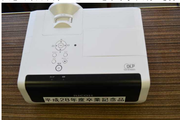
<これを2台いただきました>

3月に卒業する6年生から、「短焦点型プロジェクター」を2台、卒業記念品としていただきました。プロジェクターは、パソコンや実物投影機の画像・映像をスクリーンに映す機械です。そして、これは「短焦点型」と言って、スクリーンのすぐ近くから映し出すことができる最新型です。これで、狭い教室などでも大きく映し出すことができます。大切にに使わせていただきます。ありがとうございました。