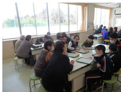
【せんべい汁打合せ】

・八戸に引っ越してきて、3年生の授業の見守りに参加しました。いろいろ戸惑いましたが、学校の様子、クラスの様子、子どもの様子などが分かったので、参加してすごくよかったと思いました。これからも、機会があればお手伝いしたいと思います。《校外学習・学習補助》