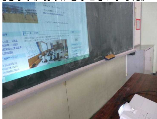
<こんな近くから映せます>